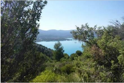
Vue sur le lac de Sainte-Croix

Affiliée à la F.F.M.E. Affiliée à l'AA.N.C.V.